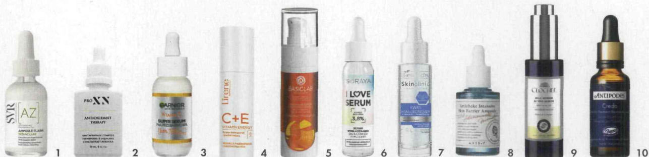
1. Serum z kwasem azelainowym do cery problematycznej Sebiaclear Ampoule AZ Flash SVR 139 zł, apteki 2. Kuracja z ksantohumolem Antioxidant Therapy PROXN 398 zł, proxn.eu 3. Silnie skoncentrowana formuła z 3,5 proc. witaminy C, niacynamidem, kwasem salicylowym Super Serum na Przebarwienia GARNIER 44,99 zł, drogerie 4. Revitalizujący krem koncentrat C+E Vitamin Energy LIRENE 29,99 zł, lirene.pl 5. Emulsyjne serum z 0,5 proc. czystego retinolu, 4 proc. witaminy C, CBD i koenzymem Q10 BASICLAB 134,90 zł, basiclab.shop 6. Serum wygładzające z kwasami do każdego typu cery I Love Serum SORAYA 17,99 zł, soraya.pl 7. Serum nawilżające-kojące Kwas Hialuronowy Bielenda Skin Clinie Professional BIELEND 35 zł, esklep.bielenda.pl 8. Artichoke Intensive Skin Barrier Ampoule AXIS-Y ok. 125 zł, axis-y.com 9. Aktywne serum 10% C-Power CLOCHEE 154 zł, clochee.com 10. Credo Probiotic Ferment Revitalise Serum ANTIPODES 231 zł, notino.pl

po oczyszczeniu. Serum mają lżejszą konsystencję niż kremy, więc pozwalają na pielęgnację warstwową: najpierw nakładamy jedno, a po wchłonięciu kolejne. Przy tak dużym zanieczyszczeniu powietrza i stresie, w którym żyjemy, w codziennej pielęgnacji musi znaleźć się ochrona przed wolnymi rodnikami, odbudowa i stymulacja. Polecam serum wodniste (oparte np. na etylowej pochodnej witaminy C) położyć jako pierwsze, potem serum z ceramidami (odbudowa), a na końcu krem lub produkt z filtrem przeciwsłonecznym. Skóra wspomagana różnymi składnikami aktywnymi jest pobudzana do ciągłej regeneracji,