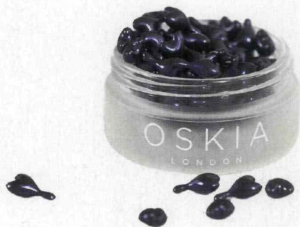
Noce serum z retinolem i witaminami do każdego typu skóry Super R Retinoid Sleep Serum Capsules OSKIA LONDON 425 zł/60 kaps., pell.pl