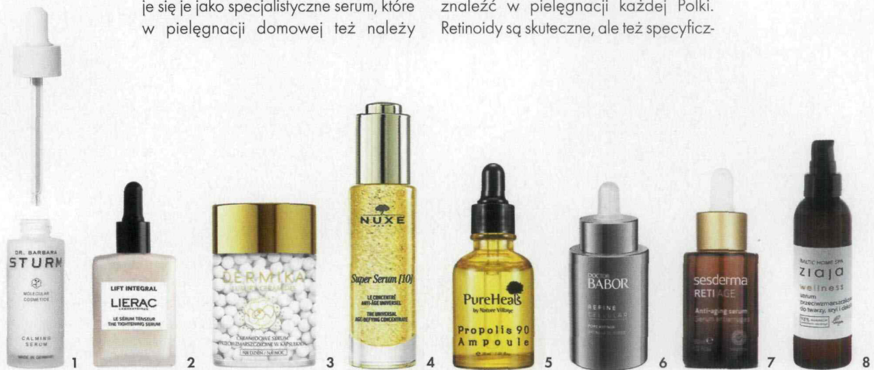
1. Molekularne Calming Serum DR. BARBARA STURM 935 zł, galilu.pl 2. Serum napinające owal twarzy Lift Integral LIERAC 229 zł, apteki 3. Ceramidowe serum przeciwzmarszczkowe w kapsułkach Luxury Ceramides DERMIKA 99,99 zł, dermika.pl 4. Olejkowy uniwersalny koncentrat przeciwstarzeniowy Super Serum (10) NUXE 309 zł 5. Ampułka PureHeals Propolis 90 PUREHEALS 89,99 zł, hebe.pl 6. Serum z 3-proc. wyciągiem z dzikiej róży Pore Refiner DOCTOR BABOR 324 zł, pl.babor.com 7. Serum liposomalne z retinolem, retinaldehydem i retinylem Reti Age SESDERMA 218 zł, sesderma.pl 8. Serum przeciwzmarszczkowe do twarzy, szyi i dekoltu z krzemem i kwasem alginowym Wellness Baltic Home Spa ZIAJA 16,61 zł, ziaja.com

ANITA ZACHARSKA: Na pewno retinol. Uważam, że ten jeden składnik o naukowo udowodnionym działaniu powinien się znaleźć w pielęgnacji każdej Polki. Retinoidy są skuteczne, ale też specyficz-